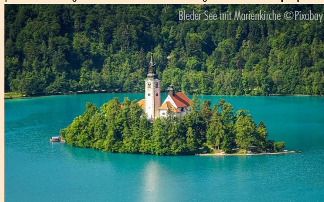
Bleder See mit Marienkirche

Reiseziele: ÄGYPTEN - ÄTHIOPIEN - ALBANIEN - ARMENIEN - ASERBAIDSCHE - BALTIKUM - BELGIEN - BULGARIEN - CHILE - CHINA - FRANKREICH - GEORGIEN - GRIECHENLAND - GROSSBRITANNIEN - IRLAND - ISRAEL - ITALIEN - JORDANIEN - KROATIEN - LIBANON - MALTA - MAROKKO - MEXIKO - OMAN - ÖSTERREICH - PORTUGAL - POLEN - RUMÄNIEN - SCHOTTLAND - SKANDINAVIEN - SLOWAKEI - SARDINIEN - SCHWEIZ - SPANIEN - SÜDAFRIKA - RUSSLAND - TANSANIA - TSCHECHIEN - TUNESIEN - TÜRKEI - UNGARN - UKRAINE - USBEKISTAN - USA - ZYPERN - KREUZFAHRTEN u. v. m.