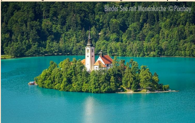
Bleder See mit Marienkirche

Reiseziele: ÄGYPTEN - ÄTHIOPIEN - ALBANIEN - ARMENIEN - ASERBAIDSCHE - BALTIKUM - BELGIEN - BULGARIEN - CHILE - CHINA - FRANKREICH - GEORGIEN - GRIECHENLAND - GROSSBRITANNIEN - IRLAND - ISRAEL - ITALIEN - JORDANIEN - KROATIEN - LIBANON - MALTA - MAROKKO - MEXIKO - OMAN - ÖSTERREICH - PORTUGAL - POLEN - RUMÄNIEN - SCHOTTLAND - SKANDINAVIEN - SLOWAKEI - SARDINIEN - SCHWEIZ - SPANIEN - SÜDAFRIKA - RUSSLAND - TANSANIA - TSCHECHIEN - TUNESIEN - TÜRKEI - UNGARN - UKRAINE - USBEKISTAN - USA - ZYPERN - KREUZFAHRTEN u. v. m.