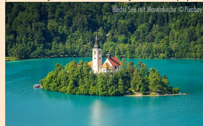
Bleder See mit Marienkirche

Reiseziele: ÄGYPTEN - ÄTHIOPIEN - ALBANIEN - ARMENIEN - ASERBAIDSCHE - BALTIKUM - BELGIEN - BULGARIEN - CHILE - CHINA - FRANKREICH - GEORGIEN - GRIECHENLAND - GROSSBRITANNIEN - IRLAND - ISRAEL - ITALIEN - JORDANIEN - KROATIEN - LIBANON - MALTA - MAROKKO - MEXIKO - OMAN - ÖSTERREICH - PORTUGAL - POLEN - RUMÄNIEN - SCHOTTLAND - SKANDINAVIEN - SLOWAKEI - SARDINIEN - SCHWEIZ - SPANIEN - SÜDAFRIKA - RUSSLAND - TANSANIA - TSCHECHIEN - TUNESIEN - TÜRKEI - UNGARN - UKRAINE - USBEKISTAN - USA - ZYPERN - KREUZFAHRTEN u. v. m.